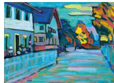
Wassily Kandinsky, Murnau – Zwei Häuser , 1908, Sammlung Braglia, Lugano