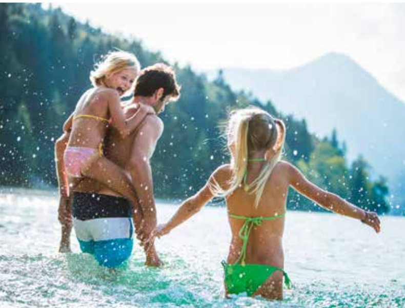
Sommer, Sonne und das Wasser des Kochelsees. Da wird der Urlaub für Kinder zu einem großartigen Vergnügen.