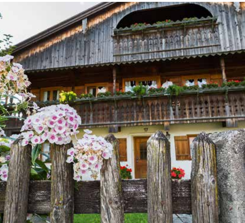
Liebevoll gepflegte Bauernhäuser und Gärten – bei uns werden Traditionen gelebt.