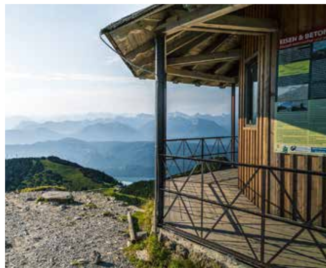
Vom Gipfelpavillon auf dem Herzogstand genießt man eine grandiose Aussicht.

B11 gegenüber vom Café am See. Auf 2,5 km Länge erfährt man auf 7 Ausstellungstafeln Wissenswertes über Leben, Werke und Werdegang des Künstlers. Der Kunstthemenweg endet am Walchensee-Museum in Urfeld. Einen Flyer mit detaillierter Wegbeschreibung erhalten Sie in der Tourist Information Walchensee und Kochel a. See.