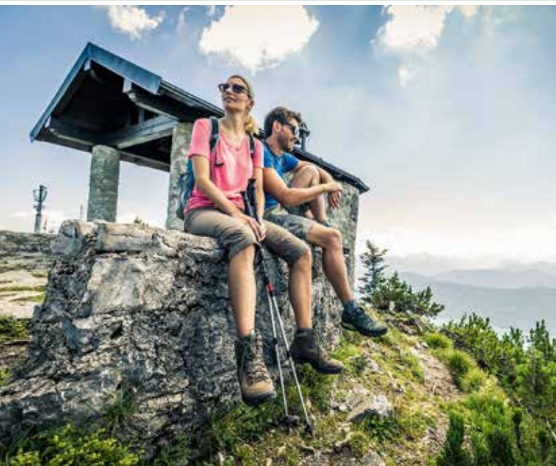
Wandern in einer Gegend, in der schon Könige Berge und Ausblicke genossen haben.