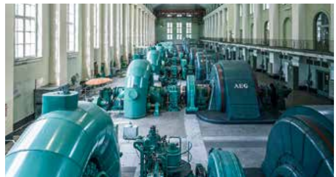
Blick in die Maschinenhalle

Geöffnet: Mai - Oktober täglich 9 - 17 Uhr, November - April täglich 10-16 Uhr. Juni - Oktober jeden Dienstag 16 Uhr kostenlose Führungen für Urlaubsgäste. Anmeldung nicht erforderlich, Treffpunkt Infozentrum Kraftwerk