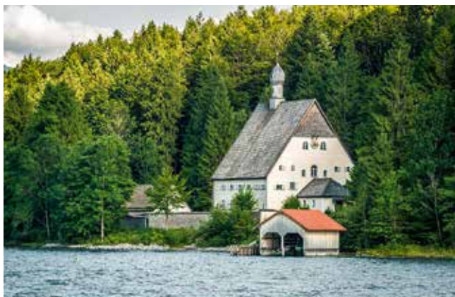
Das Klösterl hat eine wechselhafte Vergangenheit erfahren.