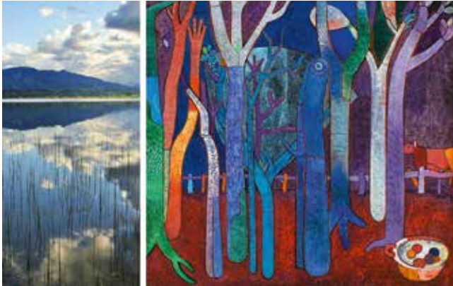
Heinrich Campendonk, Bäume (Detail) , um 1946, Museum Penzberg Sammlung Campendonk