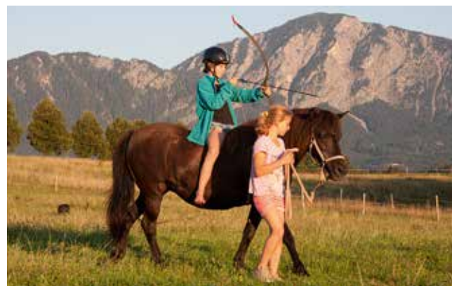
Kinderreitkurs auf dem Islandpferdehof „Blauer Reiter“

Weitere Termine im Veranstaltungskalender, Informationen in den Tourist Informationen Kochel a. See, Walchensee und Infopoint Schlehdorf.