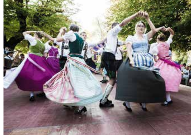
Der Heimattag am Kochelsee lässt Tradition erleben und lädt zum Mitfeiern ein.

Die katholische Pfarrkirche St. Michael, die ihren heutigen Turm sowie das Gewölbe im Schiff um 1680/85 und ihren edlen Stuck zwischen 1725 und 1730 erhalten hat, verkörpert wie kein anderes Bauwerk der Gemeinde die Tradition der „neueren Geschichte“ des Ortes. 739 wurde im Zuge der Kirchenreform das Frauenkloster Kochel a. See von dem aus England stammenden Missionar BONIFATIUS geweiht. Um 955 wurde das Kloster Kochel a. See durch die Ungarn zerstört und nicht wieder aufgebaut. 1071 wurde eine zweite Kirche geweiht. Der Name „St. Michael“ tauchte erstmals im 11. Jahrhundert auf und spricht für eine enge, jedoch nicht geklärte Beziehung zu St. Michael auf der Insel Wörth im Staffelsee. Auffällig ist die klassizistische Kanzel. Auf dem Friedhof, der an die Pfarrkirche angrenzt, befindet sich das Grab des Expressionisten FRANZ MARC und seiner Frau MARIA. Am Aspensteinbichl steht die 1914 errichtete evangelische Kirche. Im Inneren weist sie Jugendstilelemente auf. Sehenswerte Kapellen findet man auch in den Ortsteilen Altjoch (17. Jh.), Ort (1829), Ried (1841) und Pessenbach (1827).