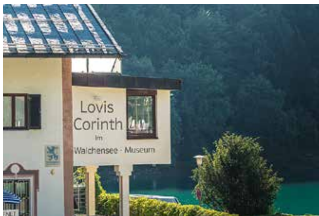
Die Lovis Corinth-Sammlung umfasst ca. 300 Originalgraphiken.