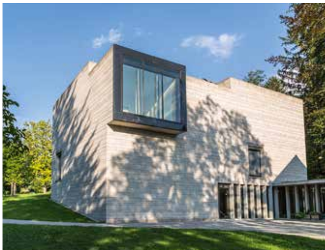
Ein moderner Museumsbau, der sich harmonisch in die Natur einfügt.