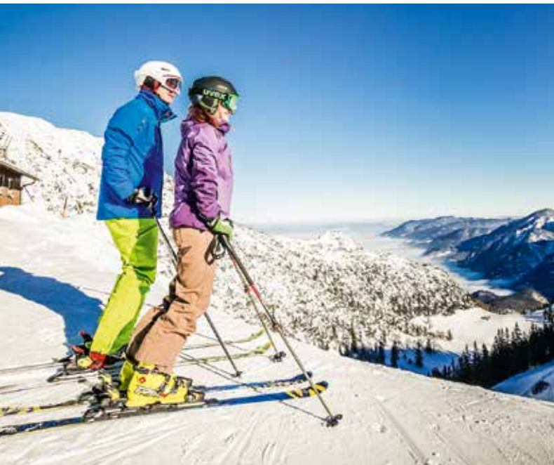
Die Hänge des Herzogstandes bieten Skierlebnisse mit grandiosem Bergblick.