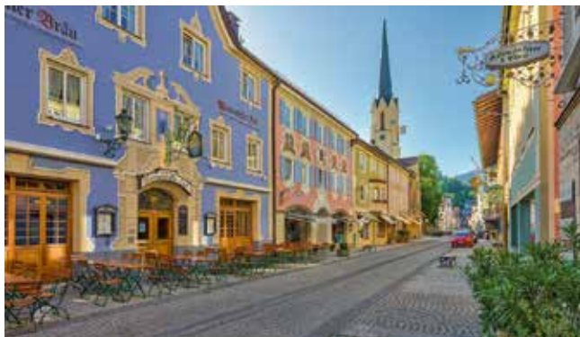
Häuserfassaden mit traditionellen Lüftlmalereien in Garmisch-Partenkirchen