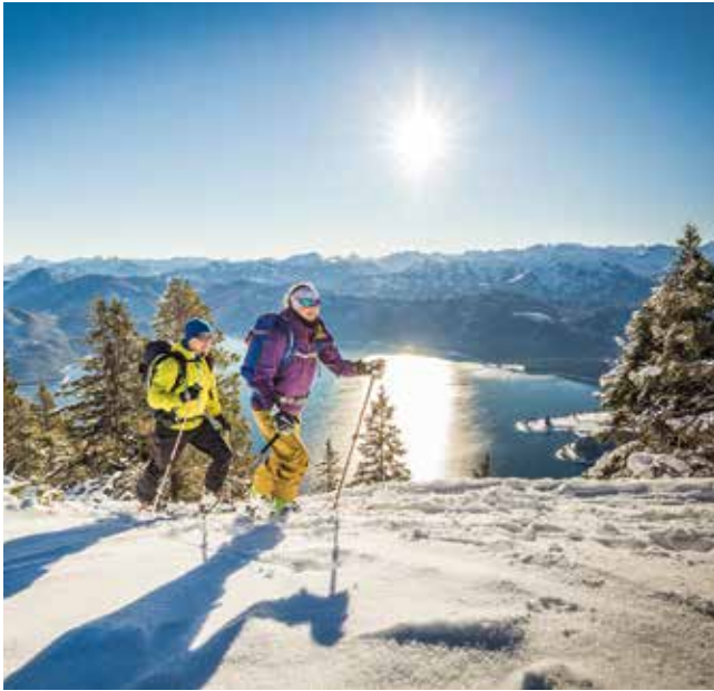
Die Berge rund um die Seen sind für Skitourengeher ein absolutes Highlight.