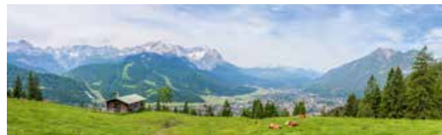
Atemberaubende Bergwelt mit lieblichen Almen und schroffen Gipfeln

„In der Natur und mit der Natur“. Einzigartige Erlebnisse für die ganze Familie: ein Besuch der Aussichtsplattform AlpsiX. Der Ausblick dort garantiert weiche Knie: 1.000 Meter tief schaut du in das Höllental und in Richtung Zugspitze. Oder eine Wanderung durch die Partnachklamm. Mit ihren rauschenden Wasserfällen und Stromschnellen gehört sie sowohl im Sommer als auch im Winter zu den eindrucksvollsten Naturschauspielen der Alpen. Hier beginnen auch zahlreiche Touren, wie zum Beispiel die Wanderung zum Königshaus am Schachen, in dem einst König Ludwig II. residierte. Im Kletterwald am Wank ist die richtige Balance aus Mut, Geschicklichkeit und Kreativität gefragt.