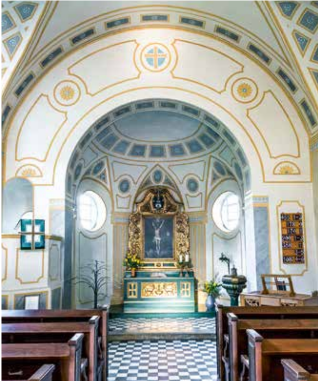
Die evangelische Kirche mit Jugendstilelementen wurde 1914 eingeweiht.