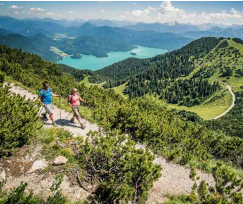
Bei guter Sicht schaut man vom Herzogstand bis zur Landesbauplatz München.