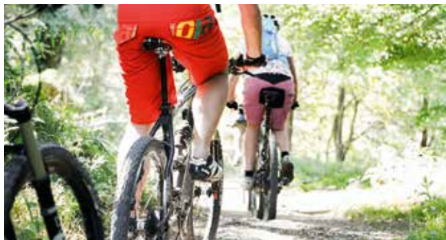
Abwechslungsreiche Touren auf unterschiedlichsten Wegen sind pures Vergnügen.