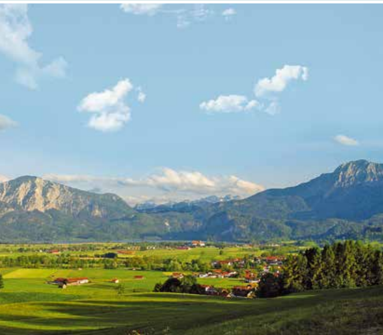
Berge, Seen und Landschaftsschutzgebiete umgeben das malerische Schlehdorf.