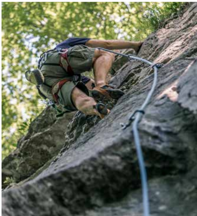
Kletterer finden hier zahlreiche Klettergärten mit Routen in allen Schwierigkeiten.