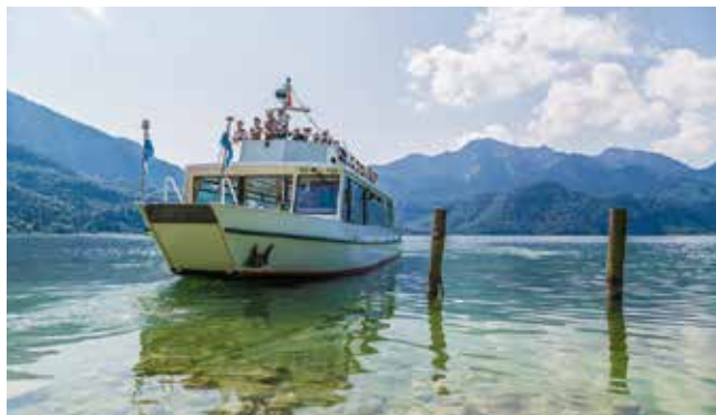
Neue Ausblicke auf die malerische Landschaft verspricht eine Motorschiffahrt.