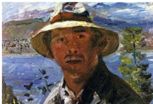
Lovis Corinth, „Selbstbildnis mit dem Strohhut“, 1923