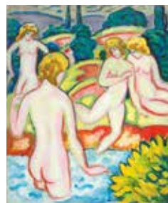
August Macke, Badende mit Lebensbäumen , 1910, Sammlung Braglia, Lugano

Ein umfangreiches museumspädagogisches Programm und öffentliche Führungen am Wochenende ergänzen die Ausstellungen. Nach dem Museumsbesuch lädt Sie das Museumsrestaurant „Blauer Reiter“ zum Genießen und Verweilen ein. Bei gutem Wetter bietet die Sonnenterrasse einen traumhaften Blick auf Kochelsee und Herzogstand.