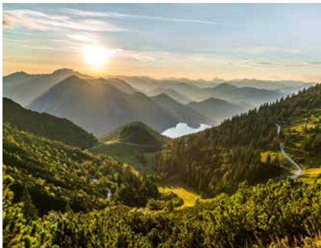
Berühmte Alpengipfel ragen im blauen Licht der Morgensonne hervor.