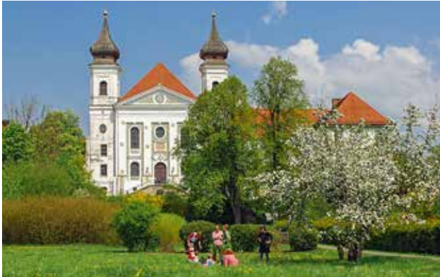
Beeindruckend ist der barocke Bau der Pfarrkirche St. Tertulin.