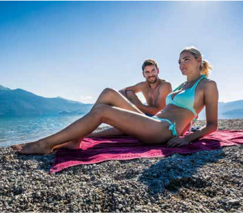
Stille Buchten und natürliche Kiesstrände laden am Walchensee zum Baden ein.