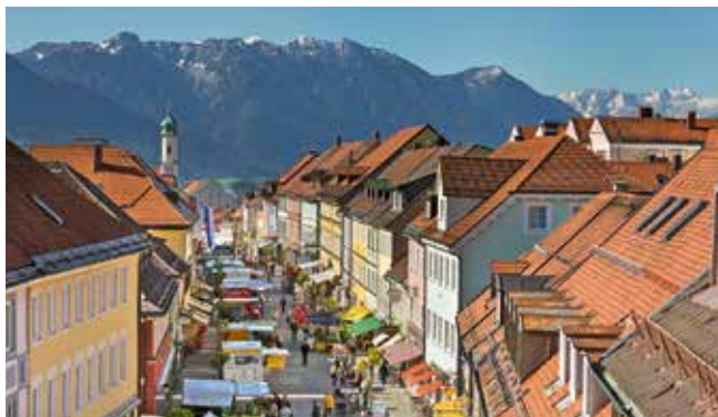
Die Fußgängerzone mit den farbigen Häuserfassaden lädt zum Bummeln ein.